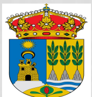
Ayto de Albánchez