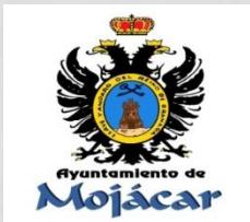
Ayuntamiento de Mojácar