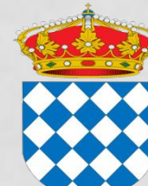
Ayto de Macael