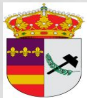
Ayto de Los Gallardos