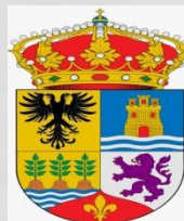
Ayto de Zurgona