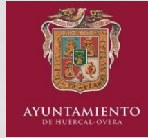
AYUNTAMIENTO DE HUERCAL-OVERA