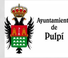
Ayuntamiento de Pulpí