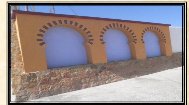
RUTA 4: GEVAS.

Continuando nuestra andadura llegamos a un cruce donde confluyen varias rutas, dejamos el camino forestal y seguimos por una vereda conocida por el nombre de "Estrechicos"